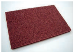
参考: 洗浄用パット例