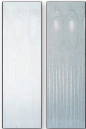
タイルフレッシュ 汎用クリヤー塗料